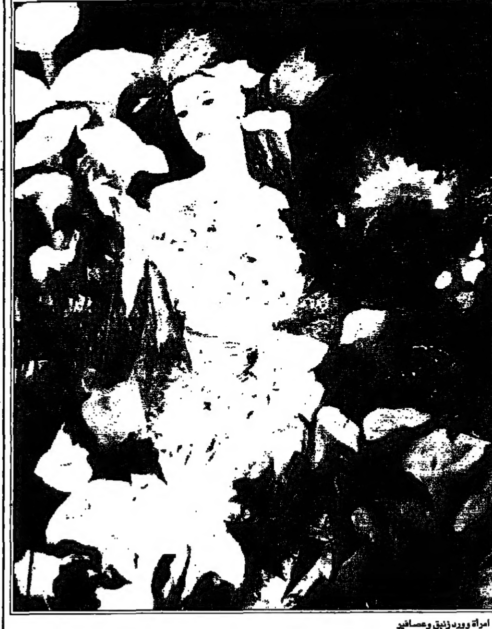
اميرة اورود ذائق وعصافير

تتضمن الندوة مقررات وبيانات، منها احصائيات حتى ان مراكز الدراسات تعتمد على مصادر اسرائيلية لعدم توفر احصائيات فلسطينية بهذا الخصوص لانتا لم تكن قارنين على ذلك. ولكن في مقررات الندوة، وفي واقع الحال، وجدت في مقررات الندوة، وفي واقع الحال، وجدت في مقررات الندوة.